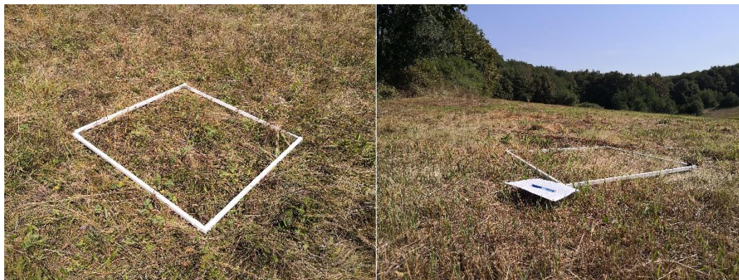
Slika 3: Vzorčna ploskev za popis kobilic

ploskve. Ko smo kvadrat položili na vegetacijo, smo prešteli vse kobilice v njem. Zabeležili smo tudi osebkke, ki so ob polaganju skočili iz kvadrata. Kvadrat smo pregledali čim bolj natančno, in sicer tako, da smo z roko počasi sistematično od ene stranice proti drugi »božali« vegetacijo znotraj kvadrata in s tem odkrili skrite kobilice. V primeru, da so bile v kvadratu prisotne rastline s trni ali žgalnimi laski, smo si pomagali s krajšo palico. Kobilic nismo določali do vrste, pač pa smo jih ločevali le na dolgotipalčnice (Ensifera) in kratkotipalčnice (Caelifera) (sliki 4 in 5).