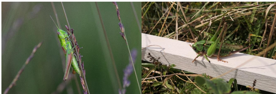
Slika 4: Zelena bleščavka ( Euthystira brachyptera )