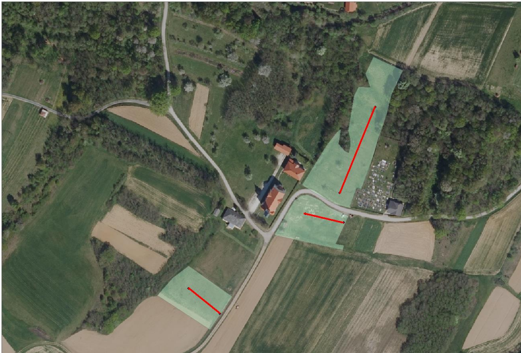
Slika 2: Primer popisnih travnikov na območju Goričkega z vrisanimi transekti

smo vrisali tudi na karto posamezne popisne ploskve. Število in okvirna dolžina transektov na posamezni popisni ploskvi so bili določeni vnaprej, in sicer tako, da smo s transektom zajeli čim večji del popisne ploskve (slika 2).